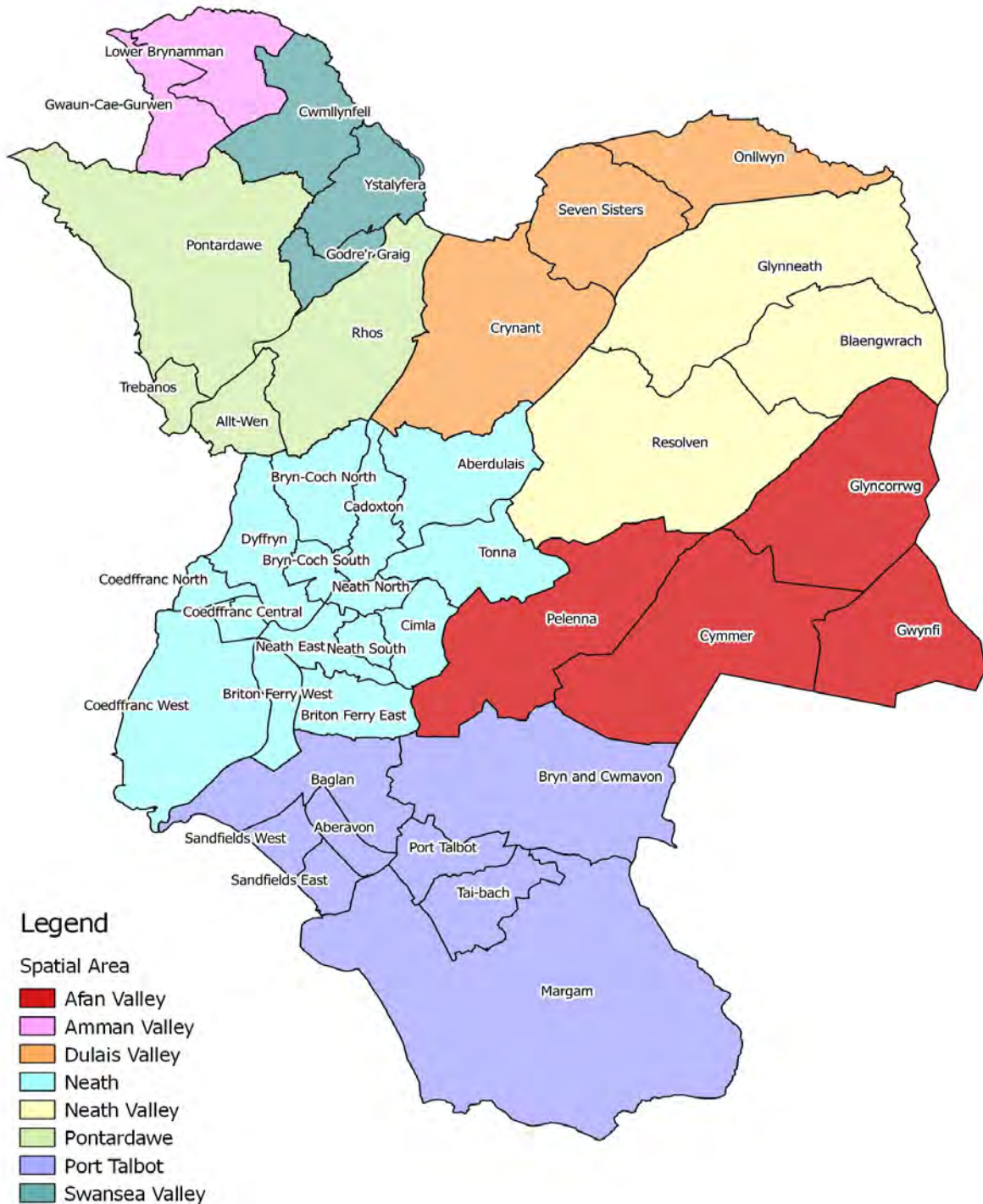
Map B.0.1 Ardaloedd Gofodol y CDLI