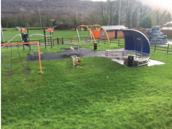
Ffynhonnell: Cyngor Bwrdeistref Sirol Castell-nedd Port Talbot.