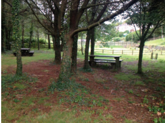
Ffynhonnell: Cyngor Bwrdeistref Sirol Castell-nedd Port Talbot