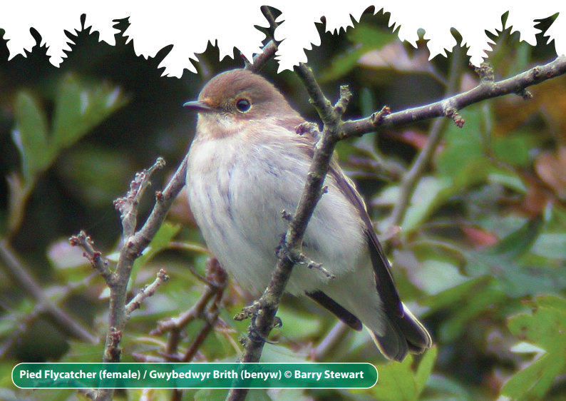
Pied Flycatcher (female) / Gwybedwyr Brith (benyw)

Redstart – Easily identified by their quivering bright orange-red tail. However, they can be difficult to find as they particularly like Oak woodland, within which they don't spend much time on the ground.